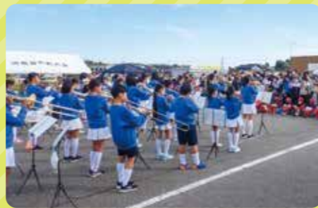
スタート式では国府小プラスバンド部の演奏や地元消防団による放水などを予定。