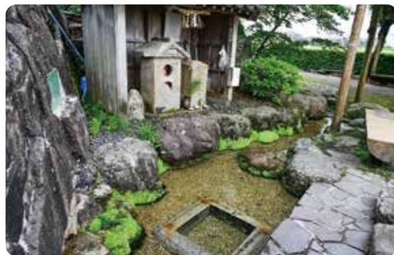
平成の名水百選 桜生水