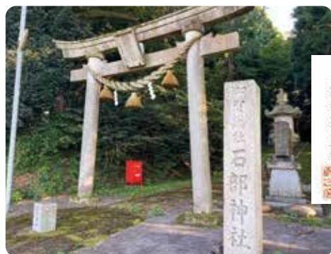
古府町石部神社(加賀国総社「府南社」推定地)