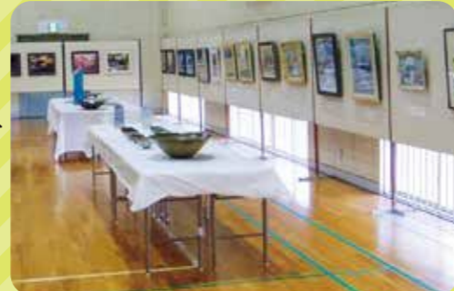
絵画や焼物など立国1200年を記念した作品を展示