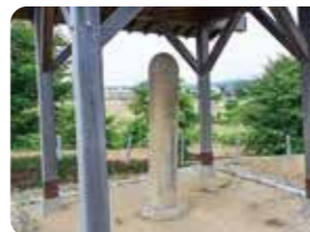
埴田の虫塚(小松市指定史跡)

天保10年(1839)に稲の害虫であるウンカが大発生し、駆除して埋めた地に虫塚が建てられています。