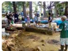
境内で確認調査中の南野台遺跡

古代瓦が採集される場所として古くから知られ、加賀国分寺推定地といわれます。現在は墓地となり、敷地内には中世の石塔群が残されています。