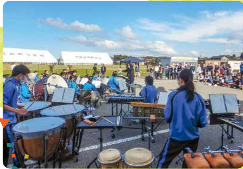
国府中学校 吹奏楽部の演奏