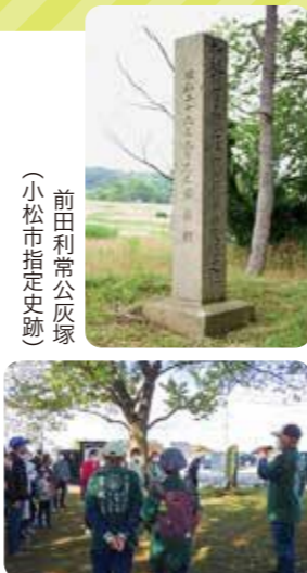
前田利常公灰塚(小松市指定史跡)