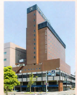
金沢ニューグランドホテル